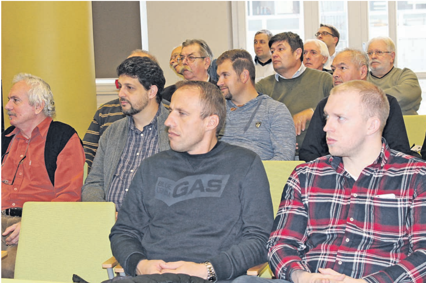
A vállalkozások képviselői a kamarai rendezvényen

SZAKMAI NAP Védelem a tisztességes vállalkozásoknak