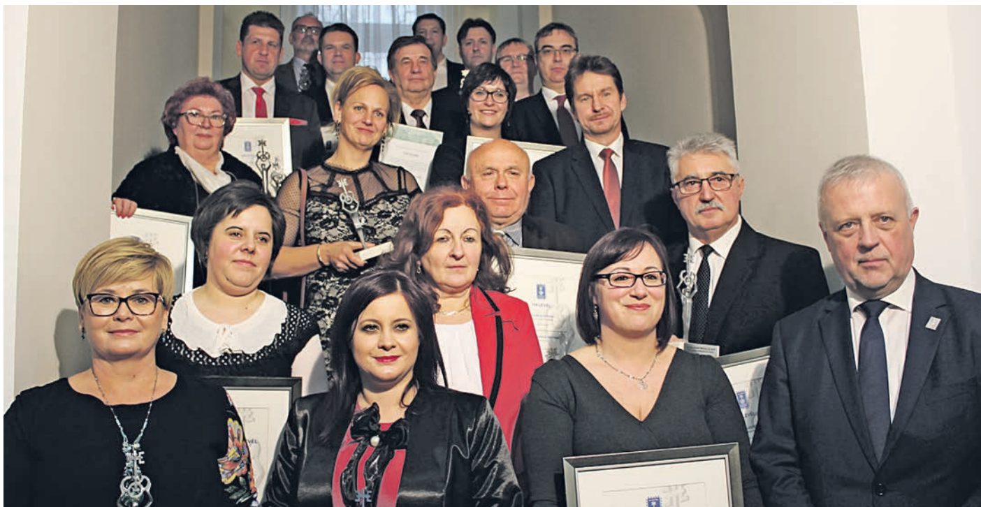
A kitüntetettek csoportja

A Hírös Hét keretében 10. alkalommal szervezett Hírös Vacsorát a Bács-Kiskun Megyei Kereskedelmi és Iparkamara, valamint a Tanyacsárda Kft. az idén. A tíz év során 72 tanuló több mint 3 000 000 Ft támogatásban részesült. A közös összefogás eredményeként idén újabb 18 fiatal támogatására gyűlt össze anyagi forrás. Az idén nyolc diák és felkészítő tanáraik kaptak magas pénzjutalommal együtt járó elismeréseket az ünnepi küldöttgyűlésen. Ők a Magyar Kereskedelmi és Iparkamara által szervezett Szakma Kiváló