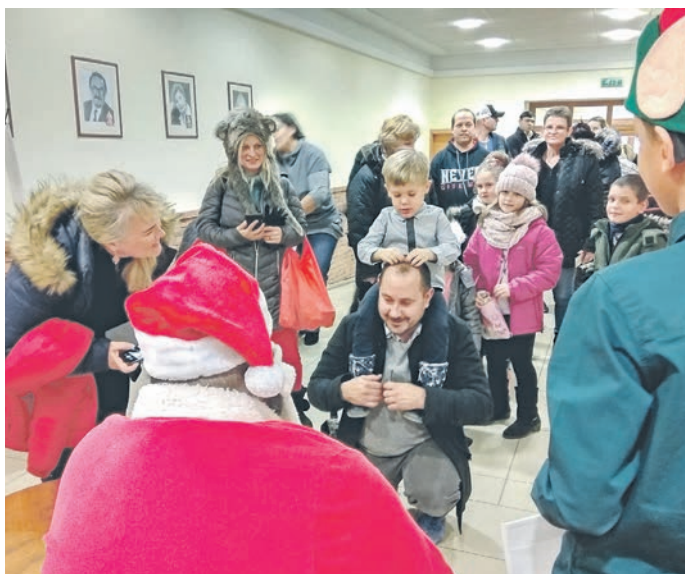
A Mikulás százhusz gyermeknek hozott csomagot