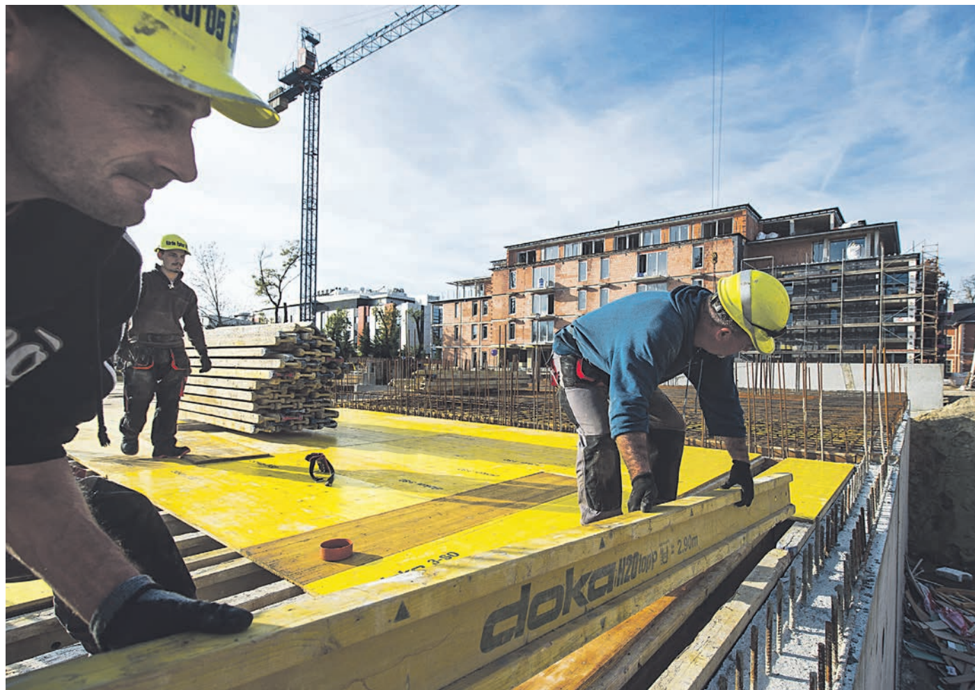
A kedvezményes építési áfa kivezetésre kerül

ELŐADÁS Adómentes juttatások szűnnek meg